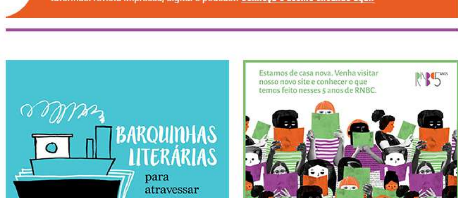
Hyago Ponto de Leitura Sol e Lua, Beabah