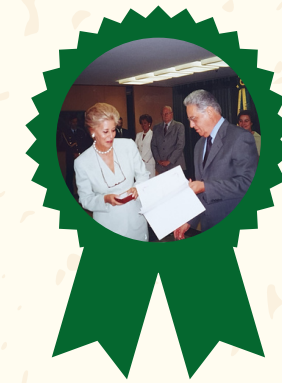
Prêmio Internacional de Alfabetização da Unesco