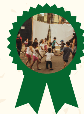
Prêmio Autocuidado escutando as vozes da quebrada