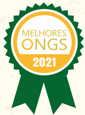
Selo Melhores ONGs