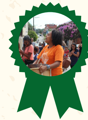
Prêmio Iniciativa Negra: Categoria Bem-estar