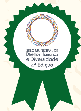
Selo Municipal de Direitos Humanos e Diversidade - Criança e Adolescente e Transversalidades