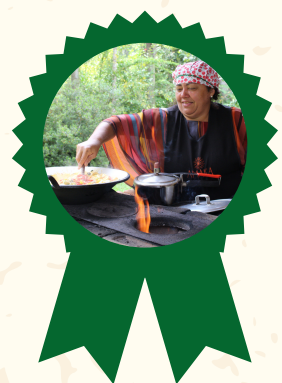
Prêmio Consulado da Mulher de Empreendedorismo Feminino