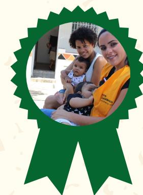
Prêmio Estímulo ao Aleitamento Materno SMSSP