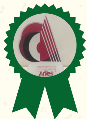
Prêmio Estado de São Paulo para as Artes - Literatura