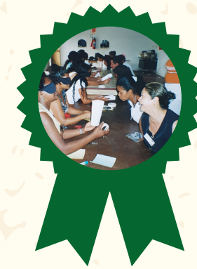
Prêmio Betinho de Cidadania e Democracia