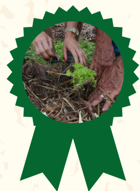
Prêmio Homenagem da ALESC de contribuições para o agroturismo